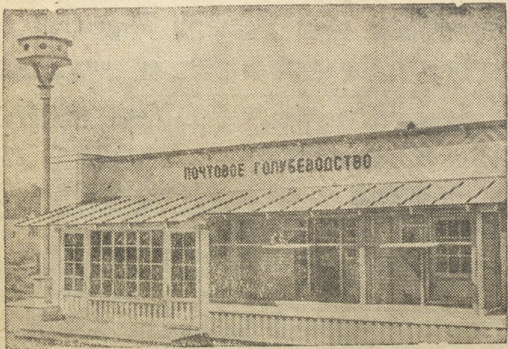
На снимке: Павильон „Почтовое голубеводство“.

Всесоюзная сельскохозяйственная выставка (Москва).