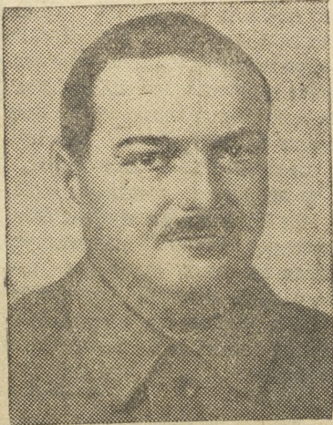
Председатель Верховного Совета РСФСР депутат А.А. ЖДАНОВ.

Обязать Моссовет и Главный выставочный комитет организовать продажу билетов для входа на Всесоюзную сельскохозяйственную выставку в кассах театров, парков и клубов во всех районах города. Москвы (всего в 40 пунктах).