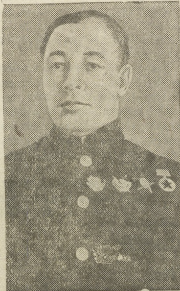
На снимке: Народный комиссар Военно-Морского Флота СССР тов. Н.Г. Кузнецов.

Культурно-массовой работы среди бойцов никакой не проводится и самим проводить культурные развлечения негде — нет у нас даже красного уголка.