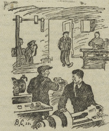
—Что-то случилось! Целый год пред- завкома не был в цехе, а сегодня в друг появился... — Не иначе — скоро будет его отчет о работе!..