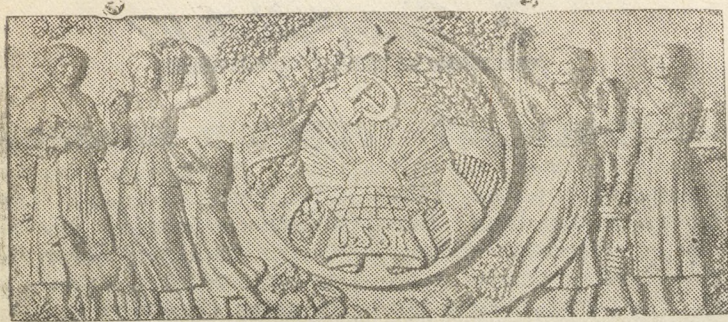
На снимке: Барельеф „Узбекская ССР“ (эскиз), Скульптор С. Надольский) Репродукция Бюро-клише ТАСС.

Павильон СССР на Международной выставке в Нью-Йорке.