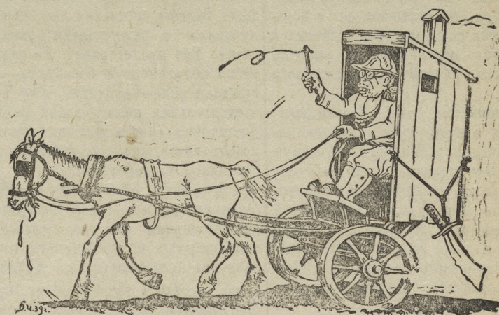
«Мальбрук в поход собрался».

(Из речи Л.М. Кагановича на XVIII съезде ВКП(б).)