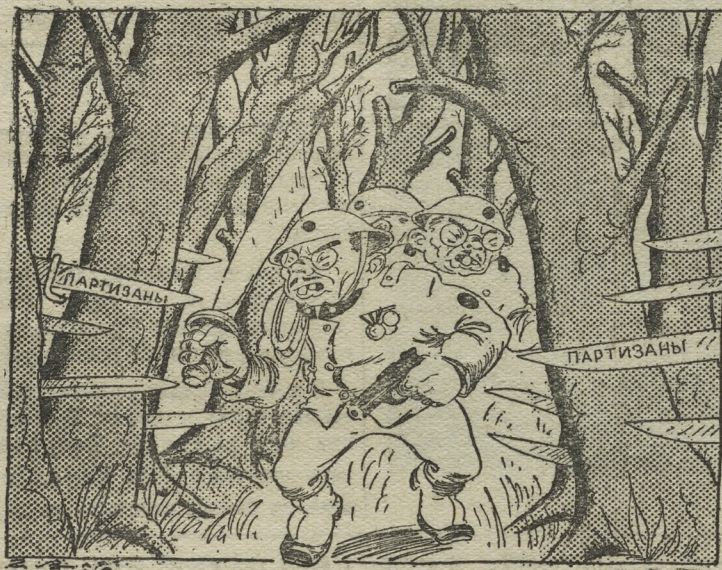
В непроходимом лесу