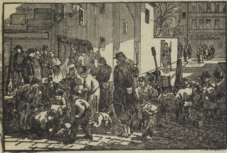
Постройка баррикады на одной из улиц Парижа

Каждый год 18-е марта проводится как день МОПР. МОПР в этот день с особенной силой призывает трудящихся к помощи жертвам фашизма. День 18-го марта—это день боевой международной пролетарской солидарности.