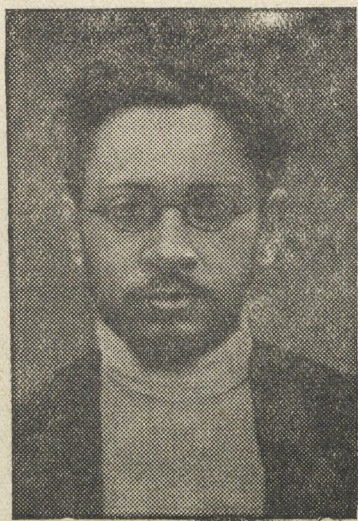
На снимке: Я. М. Свердлов в ссылке (1910 г.)

Ленин и Сталин высоко ценили Якова Михайловича Свердлова. После смерти Свердлова Ленин