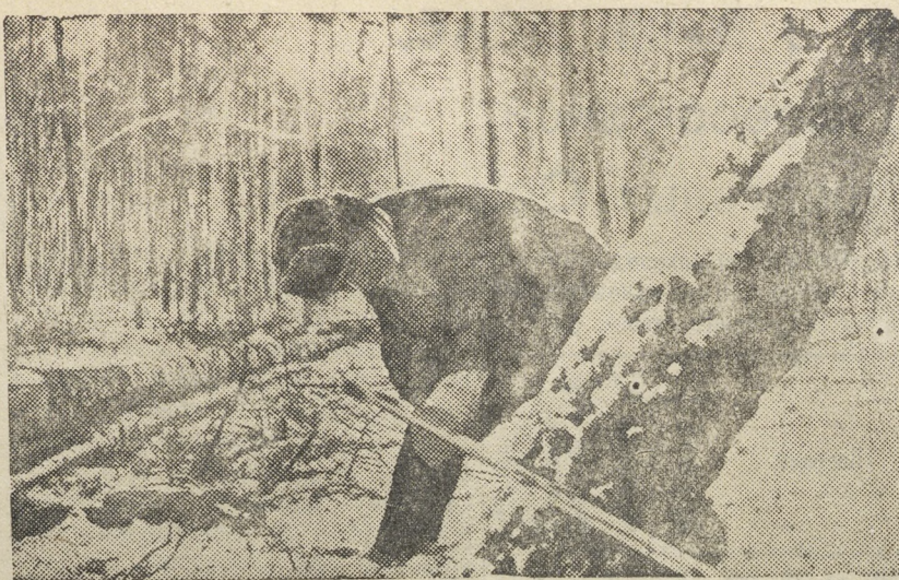
Лесозаготовки в Теплоключевском мехлесопункте Свердловска. На сн.: стахановец — лесоруб, колхозник Назип Хананов, вырабатывающий ежедневно от полутора до двух норм, за распиловкой леса.

1. Журнал «Пропагандист» № 8 за 1938 г., стр. 14.—