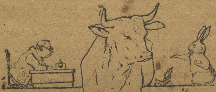
Кролик:—Подняться надо, тогда меня заметишь!

По большевистски взявшись за работу партячейки бизаны с этим делом справиться и дать путевку кролику к рабочему столу, сметая всякие возникающие на пути кролика преграды.