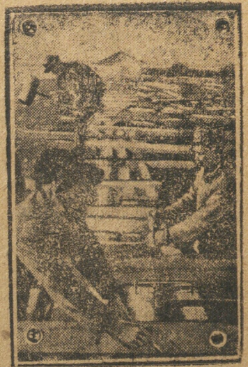
Бригада плотников за работой по объекте бонв в Дебринском запов. (Котлавский р-н, Северного края).