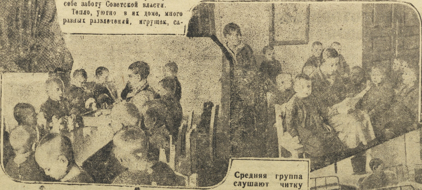
Средняя группа слушает чтение детского рассказчика.