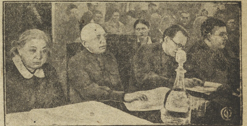
1 апреля в Колонном зале Дома Союзов открылся VIII всесоюзный съезд работников просвещения. На снимке: Н. К. КРУПСКАЯ и Нарком просвещения т. КУБНОВ в президиуме съезда.

Обеспечим за СССР экономическую самостоятельность