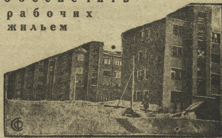
Заканчивается постройка социалистического городка на площадке Сибкомбайн.

На снимке: достраивающиеся дома для рабочих.