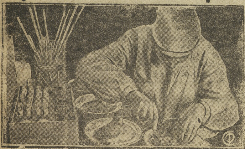
При фабрике-кухне Саратовского завода комбайнов имеется специальная лаборатория, которая проверяет качество продуктов идущих для питания рабочих.

На снимке: Лаборантка за исследованием продуктов.