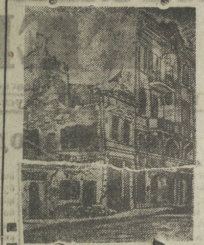
НА СНИМКЕ: Развалины домов в столице Сербии Белграде, подвергнутой австрийцами бомбардировке 28 июля (стар. стилия). 1914 г. Бомбардировка Белграда послужила сигналом к началу всеобщей мировой войны.