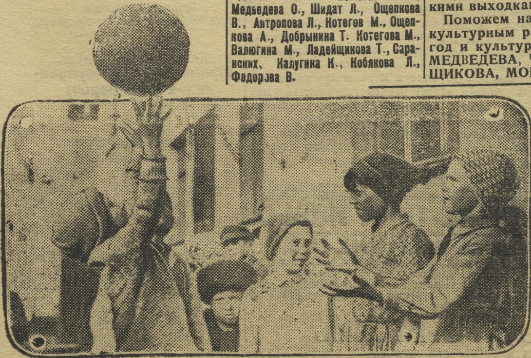
Как хорошо и тепло на улице. Дети жителя 1-го дома Горсовета по ул. Ленина (гор. Свердловска), ученики 2-го класса школы № 12 играют во дворе в волейбол.