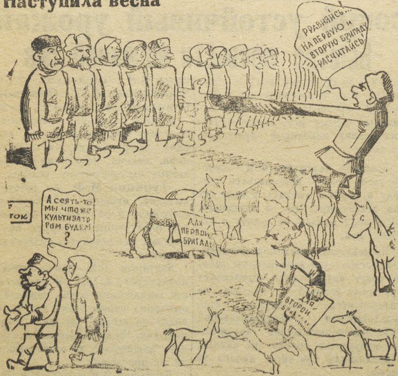
В таком виде застала она руководителей Северского колхоза.