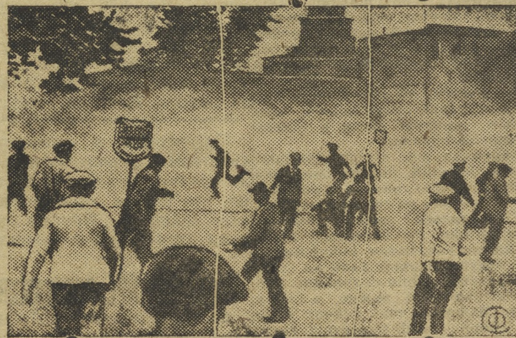
На снимке рабочие сквозь завесу слезоточивых газов забрасывают камнями полицейских.

В СОЕД. ШТАТАХ АМЕРИКИ в последнее время усилилось забастовочное движение. В г. Толидо прошла большая забастовка на электрическом предприятии „Ауто Ляйт“ полиция и войска разгоняли пикеты рабочих стрельбой и слезоточивыми бомбами. Несколько рабочих ранено.