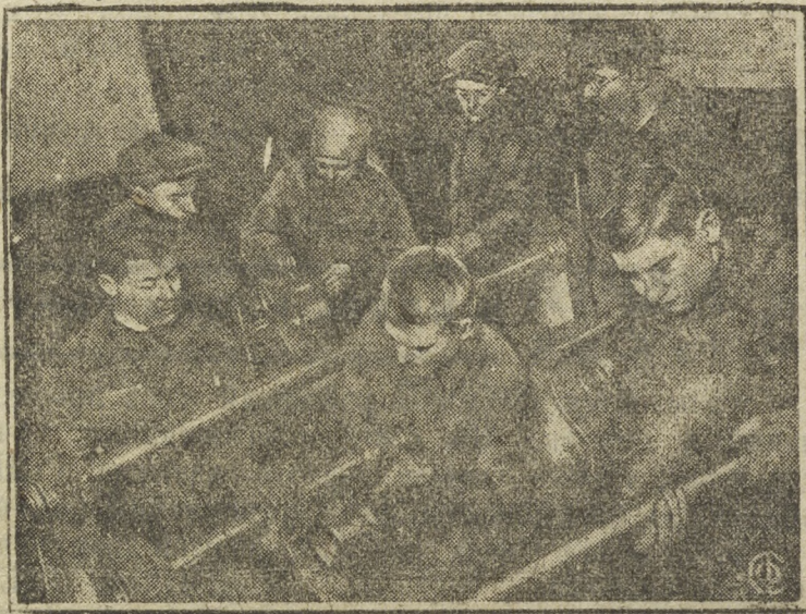
Молодежная бригада под руководством мастера инструктора овладевает техникой производства.