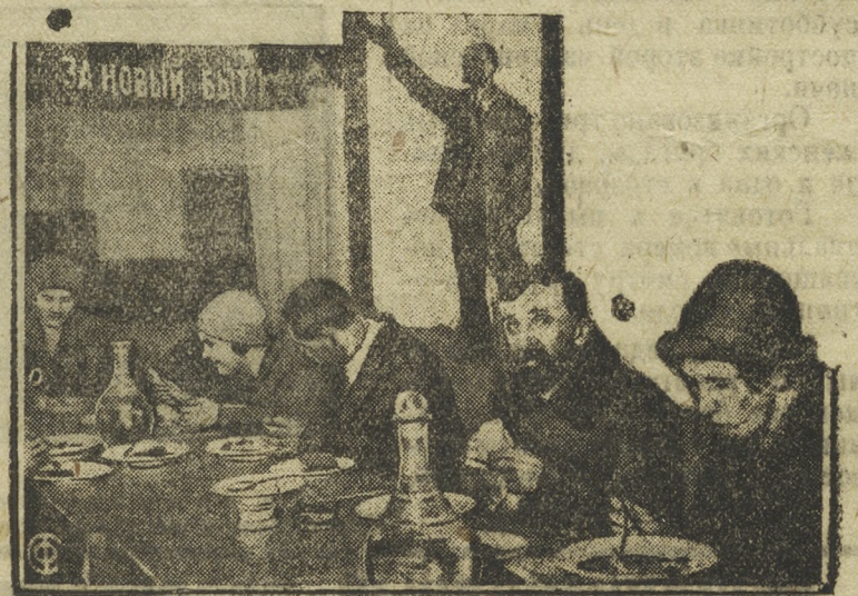
В Москве при 3-м Домтресте с 1930 г. существует самодельная столовая организованная на паевые взносы жильцов. Столовая обслуживает все население дома, кроме того 130 детей 3-х детских садов этого треста пользуются горячими обедами из этой столовой.

На снимке: За обедом в самодельной столовой.