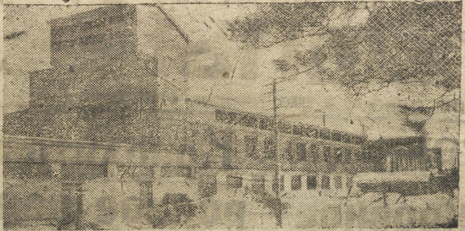
Один из корпусов Криолипового цеха

Но увы! Ничего подобного, похожего на образцовость, вы там не увидите. Как внешний вид, так и внутренний, похожи на все общежития, а около общежитий по прежнему грязь, кучи мусора, лужи воды и т.д. В общежитиях нет мебели (за исключением столиков) нет умывальников, кухонной посуды, не везде есть форточки и т.д.