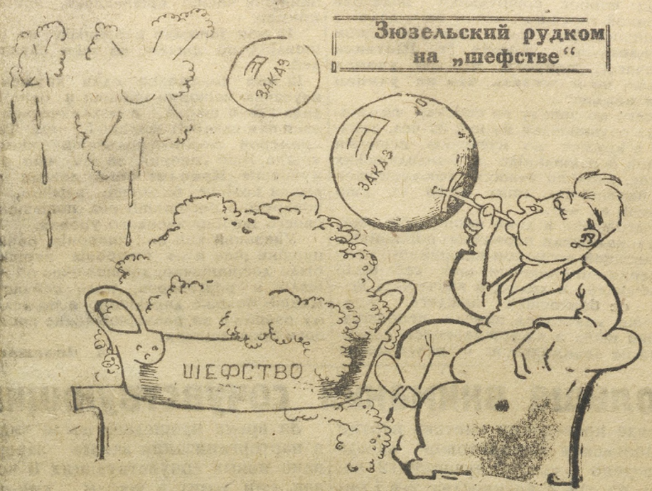
Зюзельский рудком на „шефстве“

уже затягивался—шефы—Зюзельский рудком ничего не делал и не делает. Разве так должно предприятие шефствовать над деревней и колхозом? Нет не так. От шефов требовалась тесная связь с