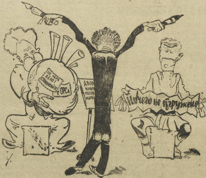
Руководители сельхозкомбината геологоразведки