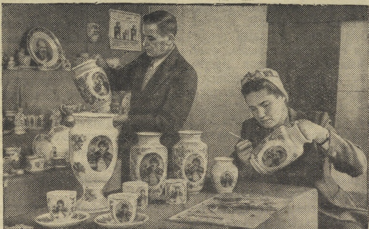
Коллектив Киевского экспериментального керамико-художественного завода в честь 300-летия воссоединения Украины с Россией готовит к массовому выпуску высококачественные изделия из фарфора с портретом Богдана Хмельницкого.

Гости примут участие в праздновании 36-й годовщины Великой Октябрьской социалистической революции в Москве, затем совершат поездки по стране.