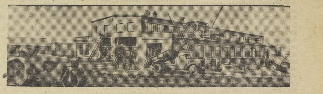
Московская область. В колхозах и МТС развернулось большое строительство. Сооружаются крупные теплицы и скотные дворы, силосные башни и другие хозяйственные постройки. Строятся новые усадьбы машинно-тракторных станций. На снимке: строительство новой усадьбы Донской машинно-тракторной станции.