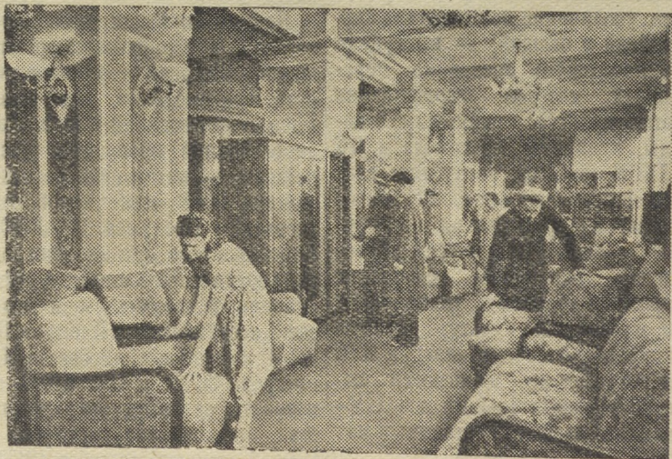
Новосибирск. С начала года фирменным мебельным магазином продано на три миллиона рублей высококачественной мебели. Недавно магазину выделено дополнительно товаров на 1 миллион 200 тысяч рублей. На снимке: в одном из отделов.

Коллектив льнокомбината несет трудовую вахту в честь 36-й годовщины Великого Октября. Текстильщики обязались дать сверх плана 200 тысяч метров полотна и сэкономить полмиллиона рублей.