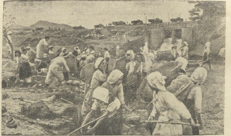
Корейская Народно-Демократическая Республика. Корейский народ, одержав победу в освободительной Отечественной войне, приступил к мирному труду. Восстанавливаются города и поселки, фабрики и заводы, водохранилища, разрушенные американскими воздушными пиратами.