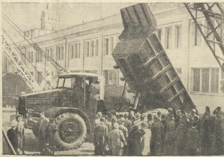
Германская Демократическая Республика. С 30-го августа по 9-е сентября в Лейпциге проходила традиционная международная ярмарка.

Приговор должен быть утвержден «Руководящим революционным советом», однако объявлению не подлежит.