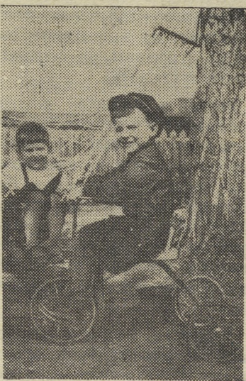
НА СНИМКЕ: малыши детского сада № 19 завода «Красный металлист» на своем участке во время отдыха на свежем воздухе.

Подсобные хозяйства ОРСа Северского завода и продснаба Криолитового завода для общественного питания сдали ранние овощи: огурцов 187 килограммов, зеленого лука 773, редиски 30 килограммов.