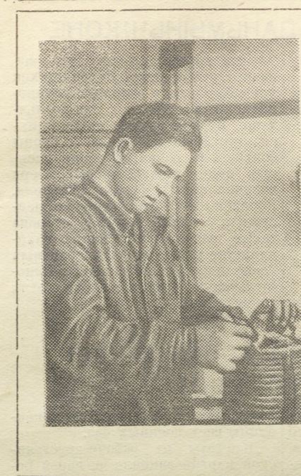
Профессия электрообмотчика на Криолитовом заводе не считается основной. Но от того, насколько будет качественно произведен ремонт электромоторов зависит работа всех цехов.

Для устранения недостатков, вскрытых рейдовой бригадой, составлен конкретный план мероприятий.