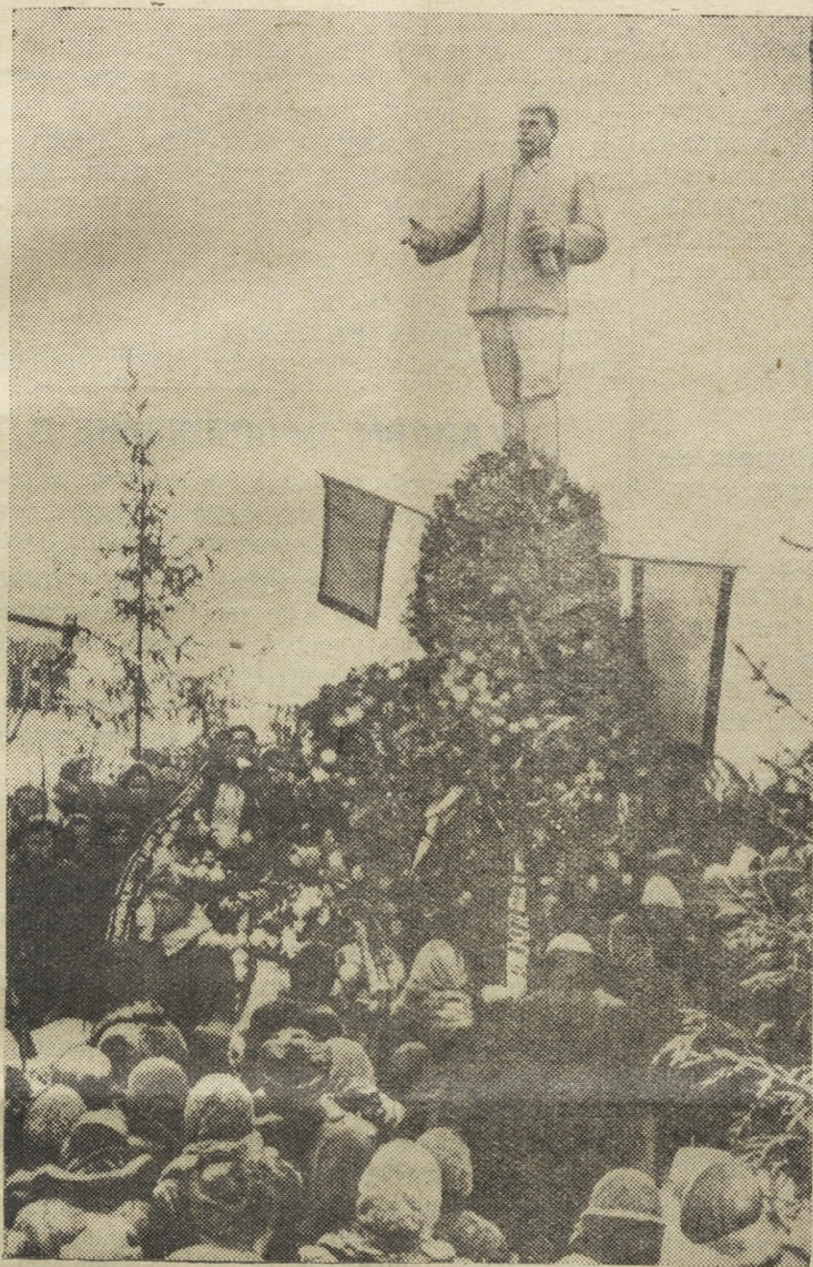
НА СНИМКЕ: Возложение венков к скульптуре товарища Сталина во время проведения городского траурного митинга.

К новым славным победам коммунизма ведет наш народ выпестованный Лениным и Сталиным, закаленный в боях Коммунистическая партия Советского Союза.