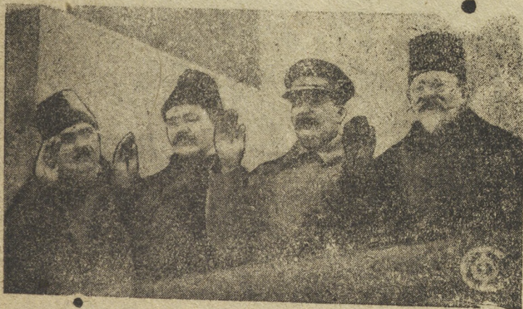
НА СНИМКЕ: —1, т. Сталин, Молотов, Каганович и Калинин на трибуне приветствуют войска.

Парад Красной армии в честь XII съезда партии.