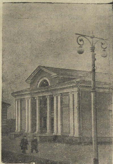
Новый кинотеатр на 330 мест открыт на поселке Малаховой горы Северского завода.