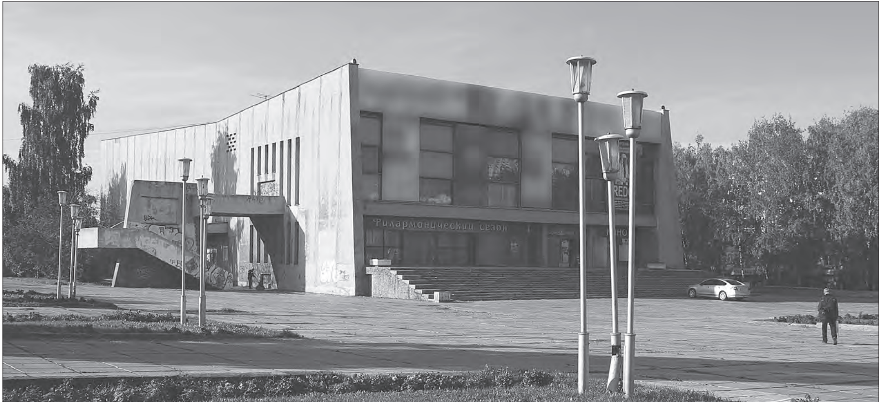
Построенное в 70-е годы прошлого столетия учреждение культуры давно перестало соответствовать громкому названию и выполнять свое предназначение.

Реализация проекта позволит тагильчанам наслаждаться творчеством лучших театральных и эстрадных коллективов страны и зарубежья, проводить различные культурные и спортивные мероприятия. Комплекс также предполагает наличие школы искусств с многофункциональными спор-