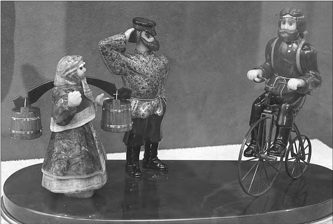
В. Васильев. «Легенда об Артамонове».

С давних времен на Урале сложилось особое, трепетное отношение человека к камню, выражающееся в преклонении перед его природным многообразием и богатством красочной палитры, перед способностью каменной материи меняться и превращаться в чудесное произведение декоративно-прикладного искусства.