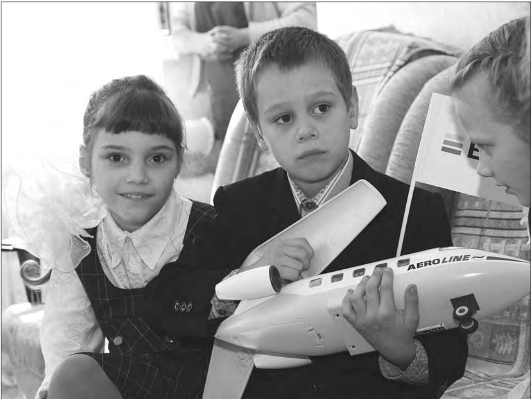
Особенно рады подаркам первоклассники.

Работники НТМК и ВГОКа перед началом учебного года сделали подарок воспитанникам социально-реабилитационного центра Тагилстроевского района «Радуга».