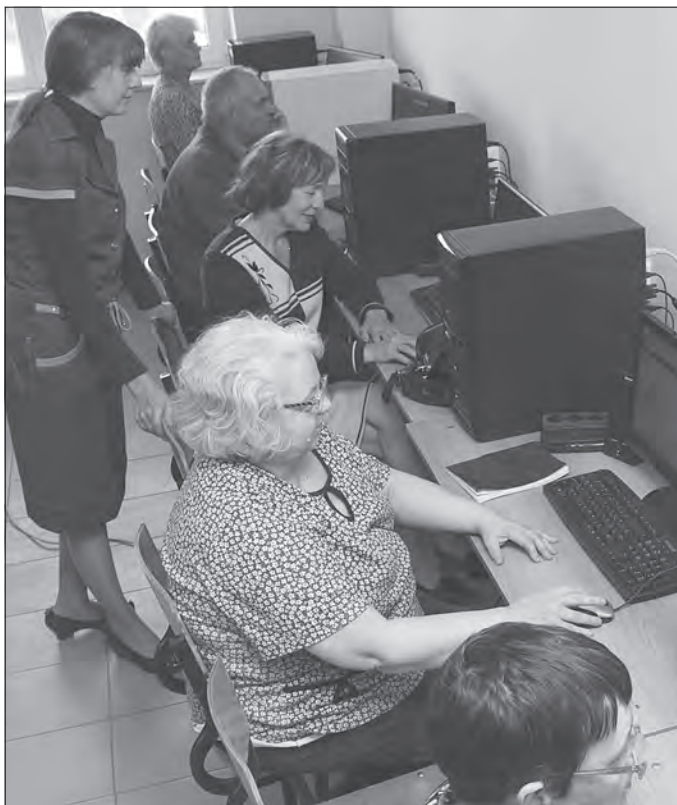
Идет урок компьютерной грамотности.