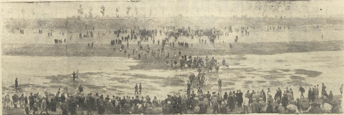
На снимке запечатлен исторический момент слияния вод Волги с водами Дона между первым и вторым шлюзами канала 31 мая.

7 июля, в 7 часов вечера, в горпарткабинете состоится очередное семинарское занятие городского партийного актива.