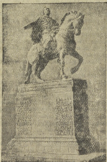
Проект памятника основателю Москвы Юрию Долгорукому. Работа скульптора Г. Мотовилова.

ТБИЛИСИ. В нескольких километрах от Тбилиси находится пустынное Гигомское плато. Здесь создается крупный виноградарский совхоз. В нем будут выращиваться 300 сортов грузинского винограда и многие сотни сортов винограда, разводимого в других республиках Советского Союза и за границей.