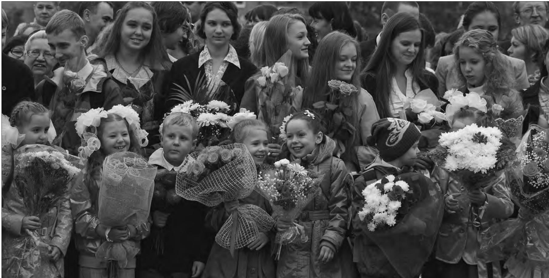
Сегодня праздник для всех.

Первые уроки в разных классах были посвящены Году истории в России и 200-летию Бородинской битвы, юбилейному Дню города или прошедшей Олимпиаде в Лондоне и победам российских спортсменов. Так стартовал новый учебный год. Римма СВАХИНА.