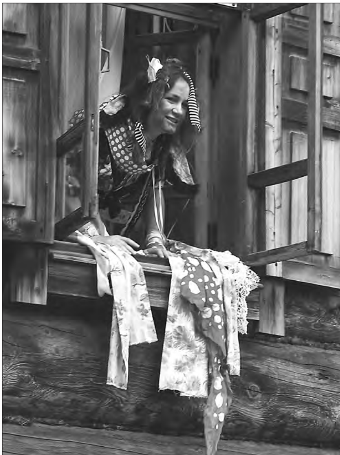
Кикимора не пускает в дом нерадивую хозяйку и ее гостей.