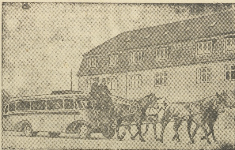
тяге. Автобус, превращенный в дилижанс, на улице Копенгагена.

В Дании из-за недостатка бензина прибегают к конной