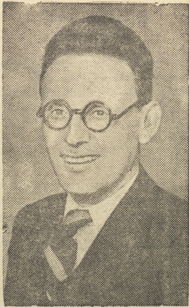
Абсолютный чемпион СССР по шахматам гроссмейстер М. М. Ботвинник.

До нас достигают, главным образом, красные лучи Солнца.