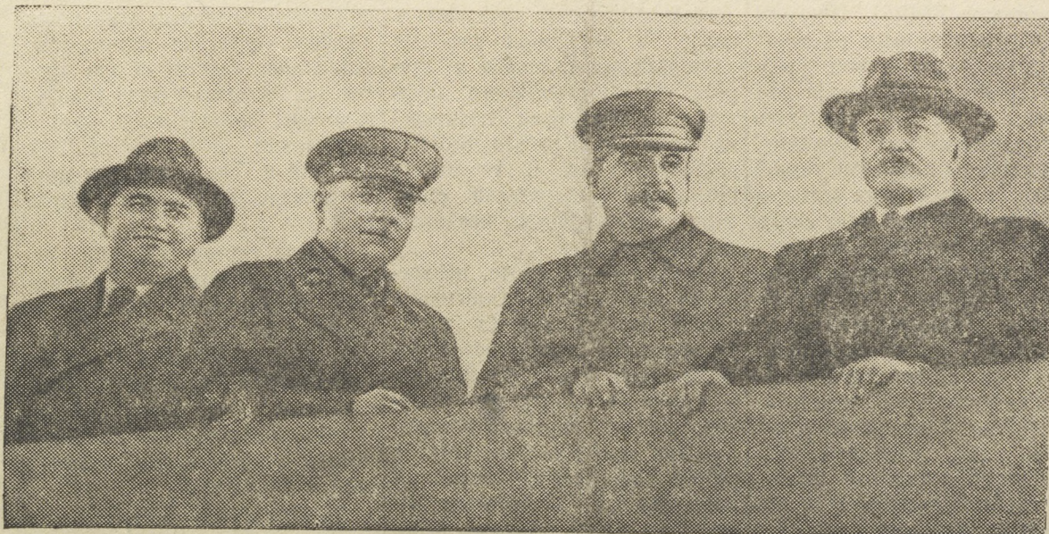
Справа налево: товарищи В. М. Молотов, И. В. Сталин, К. Е. Ворошилов и Г. М. Димитров на трибуне мавзолея.