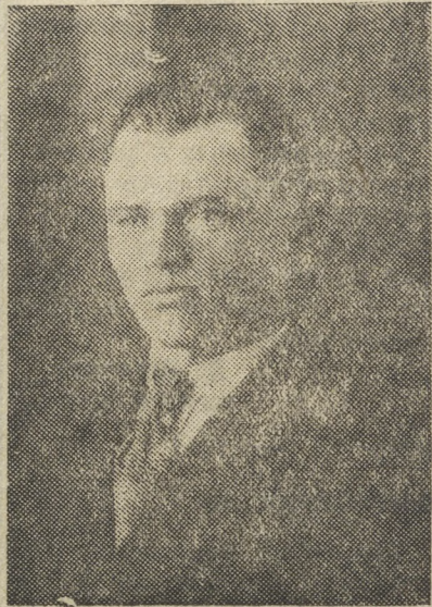
Начальник смены солевого отделения Криволитового цеха, активный рабкор районной газеты «За большевистские темпы».

В предмайском соревновании его смена заняла одно из первых мест в цехе.