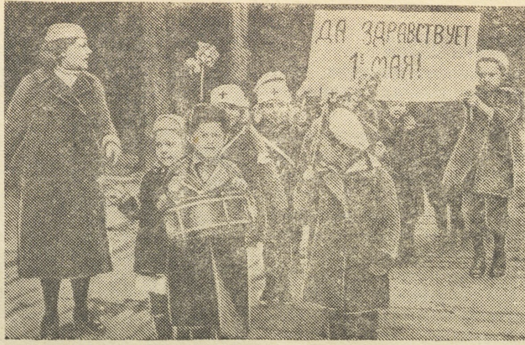
Воспитанники Режевского поселкового детского сада № 1 готовятся к первомайской демонстрации.