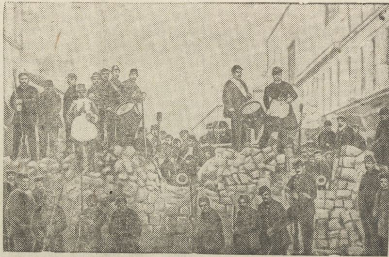
Баррикады на улице Басфруа и ул. Шаронн в Париже 18 марта 1871 г.