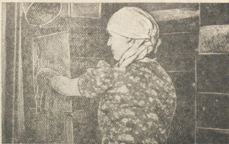
Старательские коллективы, работая в механизированных шахтах прииска «Красная горка», дают высокие показатели выполнения плана.

1940 год в жизни Кривоноговского завода был переломным. В этот операционный год завод впервые дал прибыль в 5895 тысяч рублей, в том числе 3455 тысяч рублей за счет снижения себестоимости продукции. Такие цеха, как кривоноговский (начальник тов. Замятин) дал прибыли свыше 2,5 миллиона рублей, более полмиллиона рублей дал прибыли фтористый цех (начальник тов. Сипайлов).