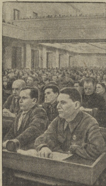
В зале заседания

б) не добиваются еще до каждого отдельного предприятия, «руководят» своими предприятиями не по существу, а формально, путем бумажной переписки;