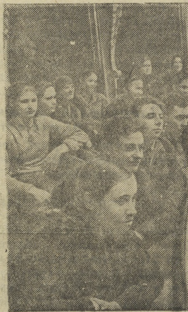
Колхозники сельхозартели «Большевик», Дальничского сельсовета в ложе театра.

К. Платонов, начальник цеха водоснабжения.