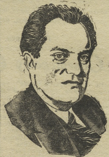
В. В. Куйбышев.

Велика честь состоять членом партии Ленина—Сталина! Но велика и ответственность, велики и обязанности, которые партия возлагает на членов партии. Они должны вести за собой массы, поднимать их мобилизационную готовность, быть впереди масс везде и всюду, где куется оборонная и социалистическая мощь нашей великой родины.