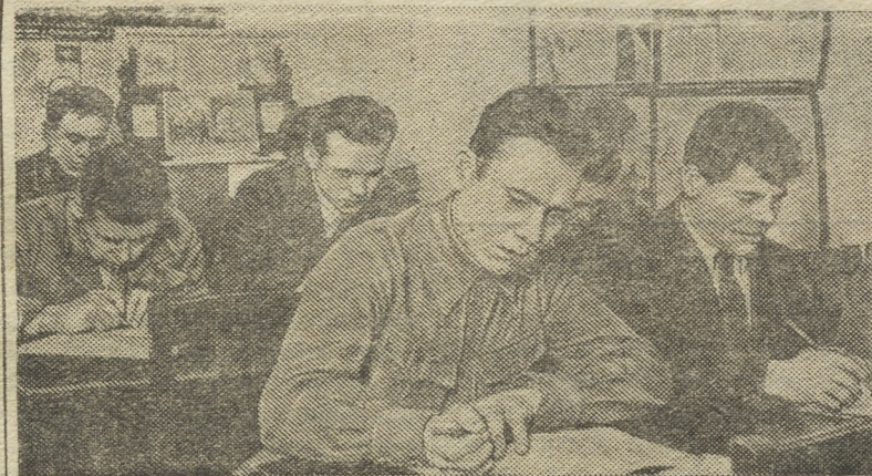
При парткабинете Ирбитского райкома ВКП(б) организована лекционная школа для партактива. В школе занимаются 62 человека. На снимке: слушатели школы на занятии.

Произведения В. И. Ленина исключительно широко распространены в Советском Союзе. Всесоюзная книжная палата подготовила сейчас предварительные данные о издании трудов Владимира Ильича Ленина за период 1917—1940 г. На русском языке работы В. И. Ленина