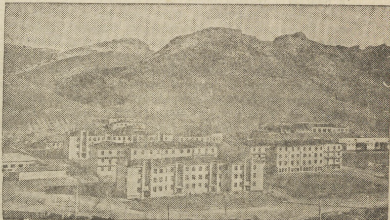
Рабочий поселок Ачисай (Южный Казахстан) в горах Кара-Тау.

Константин Алексеевич — участник областного совещания передовиков сельского хозяйства.