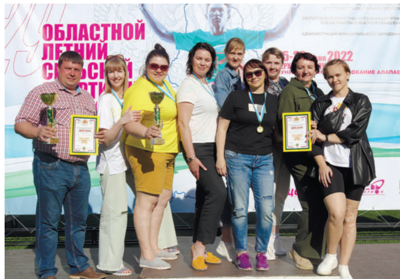
Команда ирбитских волейболисток вновь подтвердила статус сильнейшей. Как и в 2019 году, женщины завоевали «золото».