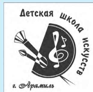
График работы специалиста по приему документов: пн – пт с 9.00 до 16 часов, Эльвира Фаргатовна Шайхутдинова.

Телефон для справок: 8 (34374) 3-01-4. Официальный сайт школы – dshi-aramil.ru.