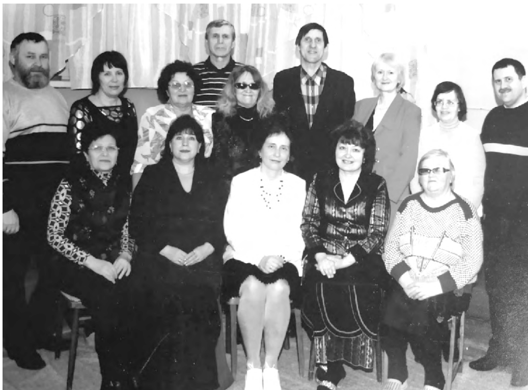
Коллектив Клуба любителей объединений в начале 2000-х годов.

В этом году Клубу любителей объединений исполнилось бы 34 года... Однако коллективы клуба, его педагоги, активисты и участники, для которых КЛО стал вторым домом, вряд ли уже соберутся вместе под родной крышей. После летних каникул творческие объединения в филиале ДК «Ровесник» на Кузнецова, 6 заниматься больше не будут.