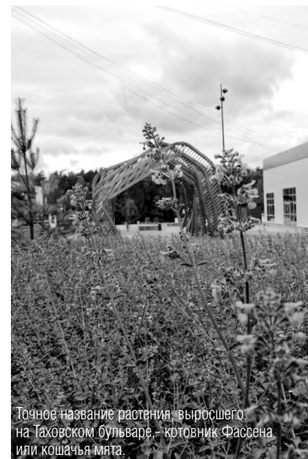
Точное название растения, выросшего на Таховском бульваре - котоник Фассена или кошачья мята.