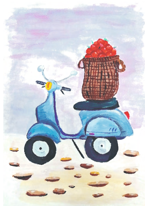
На фото мопеда - рисунок, который получился у автора, пока она беседовала с участниками арт-клуба.

тину нельзя было спасти. Бывало, что кто-то капнет посередине, или рукой что-нибудь отпечатает. Но где-то можно тень положить, веточку, скрывающую изъян, вывести. В