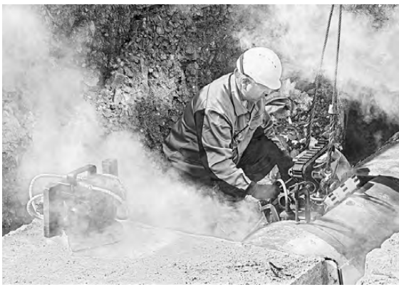
Диагностика труб с помощью робота — самая точная.

Энергетики Екатеринбургской теплосетевой компании (ЕТК) проводят диагностические испытания тепломатристралей с помощью робота. Так, на участке магистральной сети диаметром 800 миллиметров по улице Токерей он за два дня протестировал 155 метров трубопровода. В этом году с помощью роботизированного комплекса специалисты ЕТК планируют исследовать более 8 километров труб — вдвое больше, чем в период ремонтной кампании 2021 года. Аппарат методом намагничивания измеряет толщину стенок трубы, выявляет коррозионные дефекты и критичность толщины стенки. Специалисты следят за процессом онлайн. Использование робота позволяет энергетикам находить потенциально слабые места, оценить запас прочности трубопровода и, предупредив повреждения, выбрать необходимый метод ремонта данного участка.