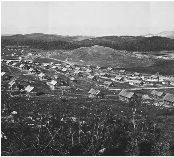
Исторические фото свидетельствуют: лысой гора была уже в начале XX века.

У нынешнего проекта есть еще и водная составляющая, ведь вредные вещества хвостохранилища и стоки с гор попадают в итоге в местный Рыжий ручей, получивший свое название за особый ржавый цвет. Тот впадает в реку Казань-Элга.